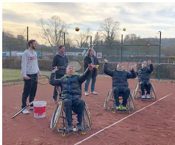
Rollstuhltennis soll populärer werden

Die Teilnahmegebühr von 10,00 € pro Person und Seminar werden zu Beginn des Seminars eingesammelt.