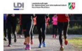
Datenschutz im Verein nach der Datenschutz-Grundverordnung

Welche Vorschriften für die Vereine relevant sind